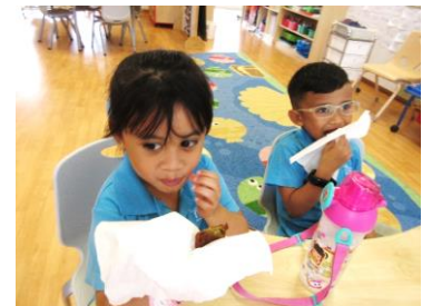
Kanak-kanak merasa Jemput-jemput Pisang.