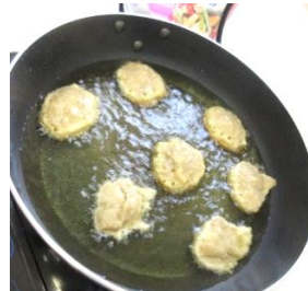
Aduanan Jemput-jemput Pisang yang digoreng.