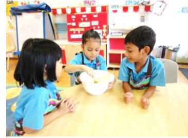
Secara bergilir-gilir, kanak-kanak mengaul bahan-bahan yang telah dicampurkan dalam adunan Jemput-jemput Pisang.