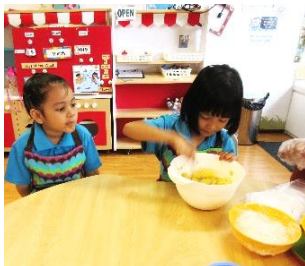
Kanak-kanak melihat adunan Jemput-jemput Pisang yang sudah siap dan cuba untuk menghidu adunan itu.