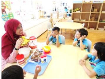
Kanak-kanak diperkenalkan kepada bahan-bahan untuk kuih Jemput-jemput Pisang

Berdasarkan maklumat yang diraih semasa menonton video di Youtube , kanak-kanak ingin membuat 'Jemput-Jemput Pisang'. Mereka ingin tahu rupa jemput-jemput pisang sebelum dan selepas dimasak. Melalui aktiviti ini, konsep deria juga telah diperkukuhkan.