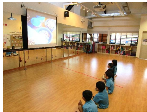
Kanak-kanak telah menonton video tentang cara membuat Kuih Lepat Pisang.

Semasa menonton sebuah video mengenai 'Kuih Lepat Pisang' yang dikukus, kanak-kanak tertarik dengan 'daun pisang' yang digunakan untuk membungkus kuih itu. Mereka ingin melihat 'daun pisang' tersebut.