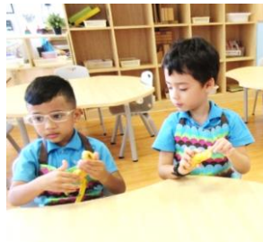
Kanak-kanak menolong mengupas kulit pisang.