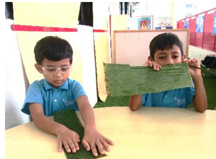
Kanak-kanak sedang meneliti daun pisang. Mereka menyentuh dan menghidu daun pisang itu.